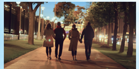
カラフルな夜間画像